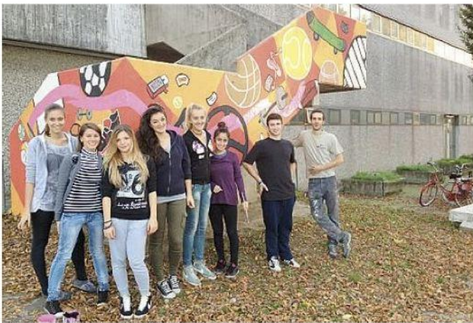
Il murales realizzato a ReggioLo dai ragazzi del progetto "Otto per otto"