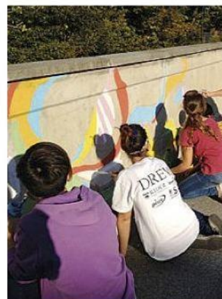
I writers lungo via Argine